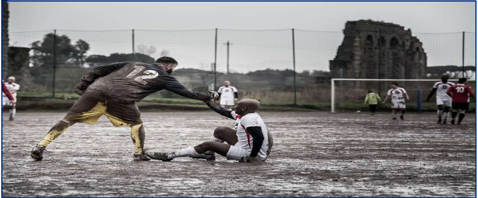
Equipo: Atletico Diritti